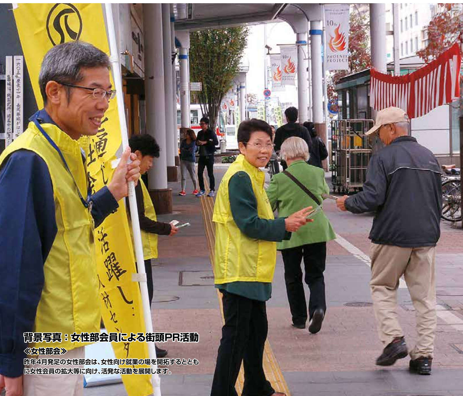
背景写真：女性部会員による街頭PR活動

発行/公益社団法人 長岡市シルバー人材センター 編集/研修広報部会 TEL 0258-35-2380 FAX 0258-37-2880